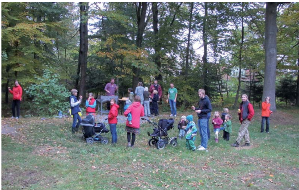
Städdag med korvgrillning i Lillan

Bredband via Affärsverkens fibernät har äntligen kommit till Bergåsa. Föreningen har under året hållit kontakt med Affärsverken för att få tidig information att delge medlemmarna. Fortsätt och anmäl intresse till affärsverken så kommer möjligheten till fiber så fort tillräckligt många per gata anmält sitt intresse!