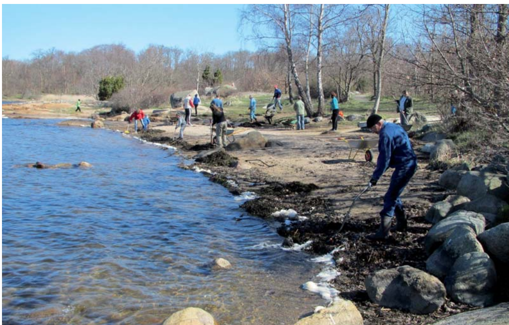
Medlemmarna deltar vid den årliga strandstädningen den 1 maj

Stranden rensades från tång och sanden jämnades och omfördelades över ytan i samband med städdagen den 1 maj.