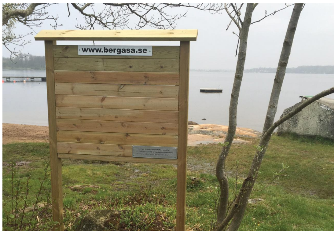
Informationstavlan som senare vandaliserades...