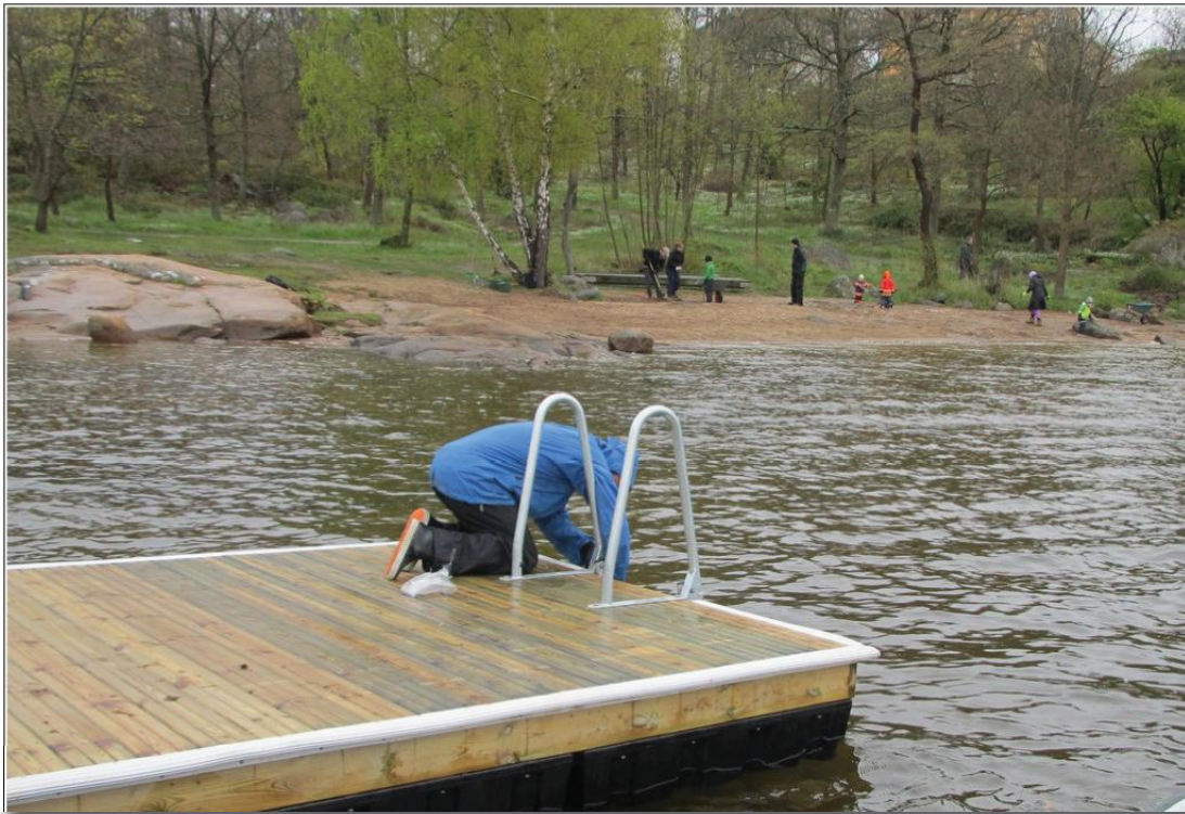
Den nya fina flotten sjösätts...