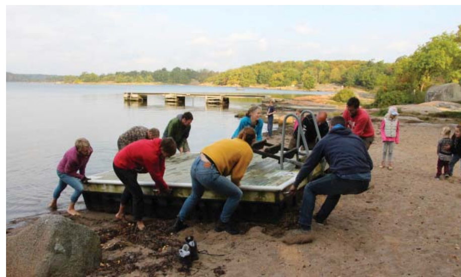
Medlemmarna i villaföreningen ansvarar bland annat för flotten...

Som medlem i villaföreningen kan man t ex hjälpa till med flottupptagning, iläggning, valborgsfirande samt vår- och höstträffar.